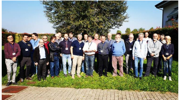
Mezzavia di Due Carrare (PD) - Ottobre 2019