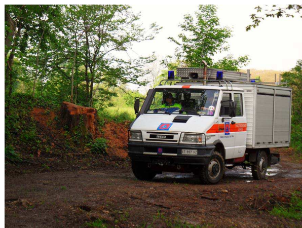
Il camion attrezzato nei pressi del torrente Cormor

Si è ipotizzato, infatti, che, a causa del panico causato dall'evento sismico, alcune persone si fossero disperse, durante la notte, all'interno della campagna e, di conseguenza, risultassero mancanti all'appello dei famigliari.