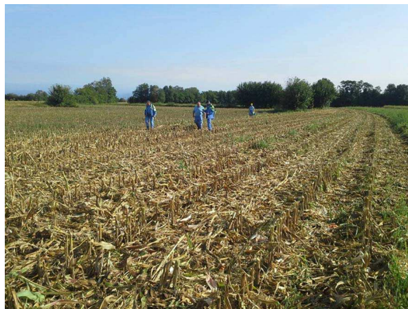
Una squadra di volontari durante le operazioni di ricerca

La seconda persona dispersa è stata ritrovata successivamente, da una squadra a terra, a seguito dell'avvistamento dall'alto della sua auto abbandonata.