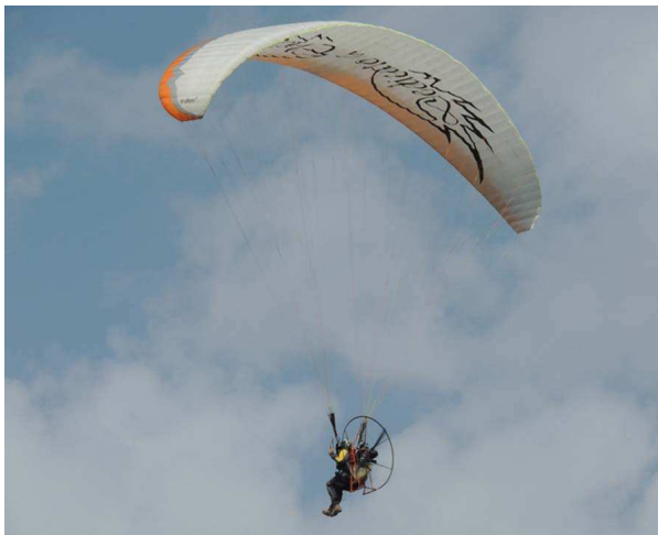
Un parapendiista del gruppo Fly Rescue Team del FESN

corso si prefiggeva il fine di abilitare i volontari al raggiungimento di posizioni geografiche specifiche con il solo aiuto delle coordinate.