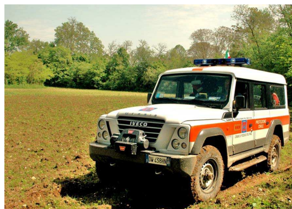
Il fuoristrada IVECO Massif di Pozzuolo durante le operazioni in campagna

ricerca di persone disperse sul terreno di campagna.