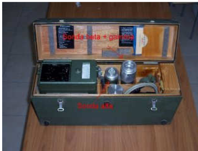
Fig. 1 - Lo strumento a scintillazione RAM 63

Lo strumento RAM 63, destinato all'uso militare e realizzato in Germania, è reperibile come surplus nelle fiere di elettronica o su Internet. In rete è possibile rilevare caratteristiche e altri dettagli di funzionamento. Si basa sulla rilevazione di radioattività mediante il principio della scintillazione, il quale prevede che le particelle Alfa, interagendo con un cristallo, producano un lampo di luce che viene rilevato da un fotorivelatore. Analogamente, per le radiazioni Beta e Gamma, le scintillazioni avvengono mediante l'attivazione di fosfori.